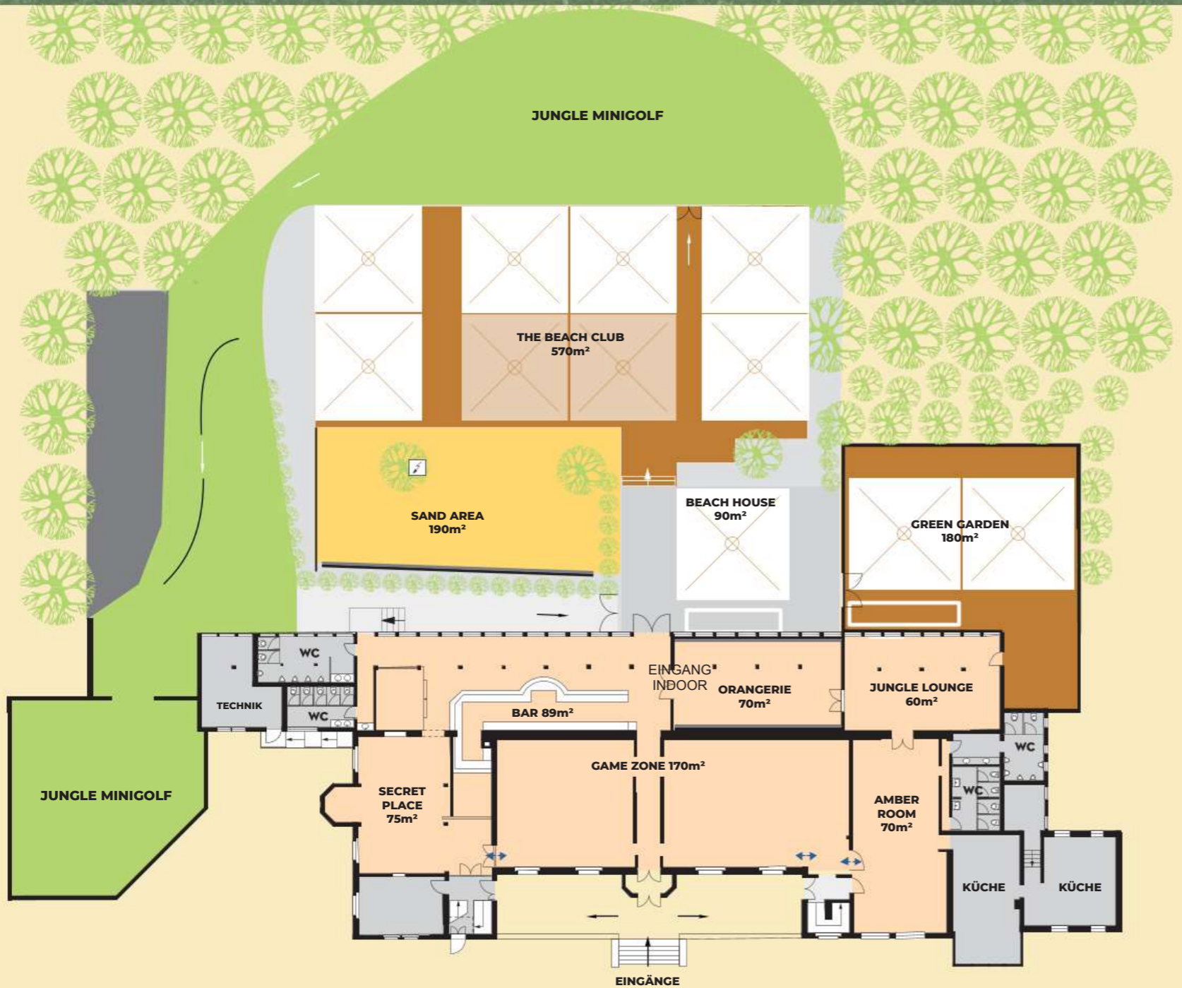
Raum- & Flächenübersicht